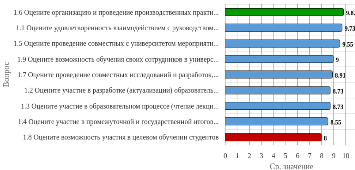
Рисунок 1.1 - Распределение показателей уровня удовлетворенности респондентов по блоку вопросов «Удовлетворенность взаимодействием с вузом»

Индекс удовлетворенности по блоку вопросов «Удовлетворенность взаимодействием с вузом» равен 9.